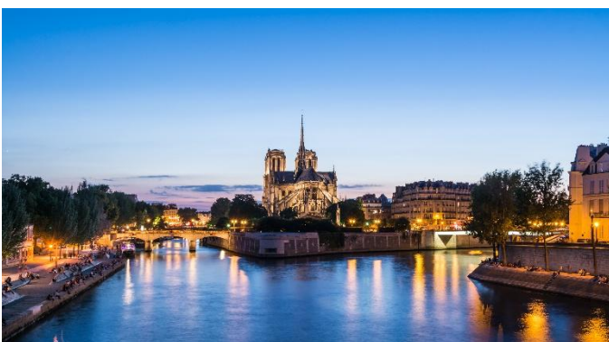
Notre Dame, Paris